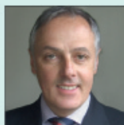
13.00 – 16.00 Uhr Alfred Mauer webrecruit